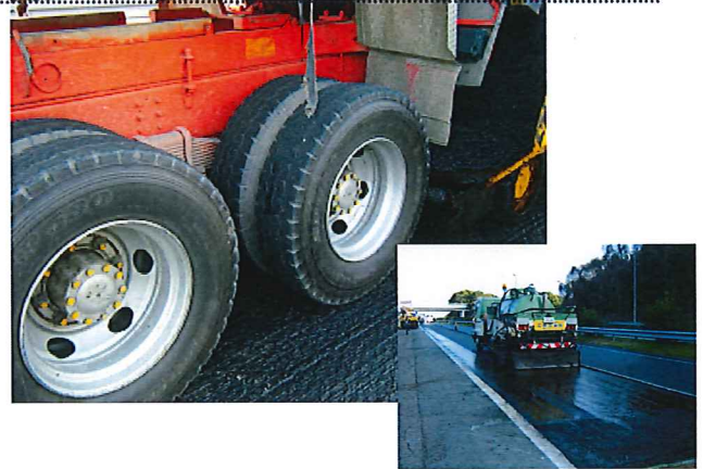
乳剤のタイヤへの付着と散布状況