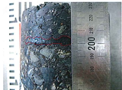
乳剤の混合物下部への充填