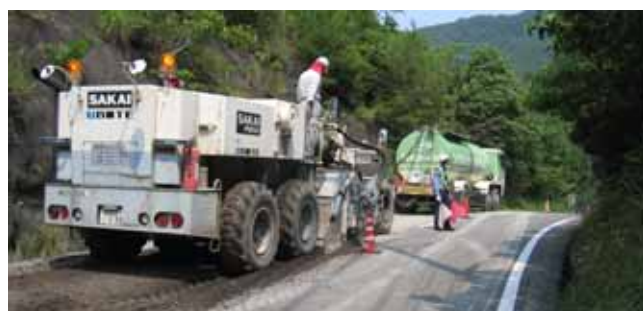
スタビライザーによる破碎混合状況