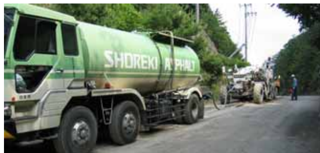
アスファルト乳剤供給状況